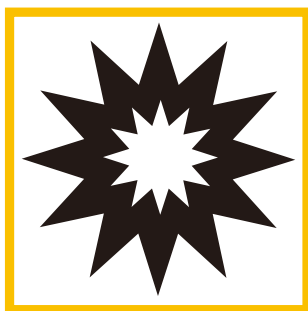
落石や衝突等の外来的事故による破損