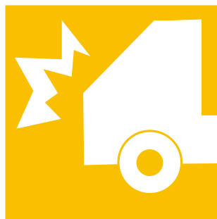
輸送用具に積載中及び 運送中に生じた破損