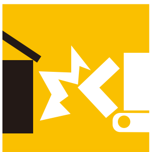
車両の衝突接触により 車両に生じた損害