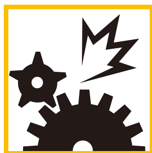
電氣的・機械的事故 (ショート・アーク等)