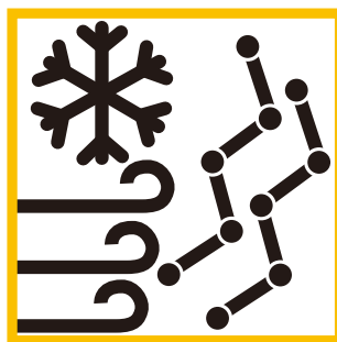
風害、ひょう災、雪災