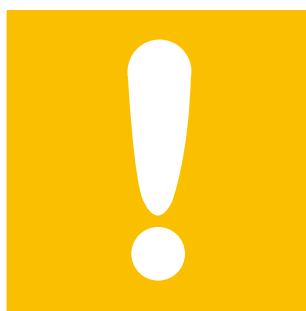
その他不測かつ突発的・偶発的 事故