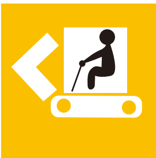
全部及び一部盗難