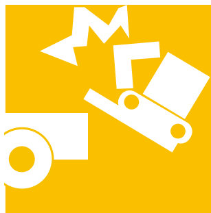
運搬用具に積込中及び 運搬中に生じた破損