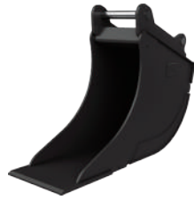
トレンチングバケット (溝掘削用)