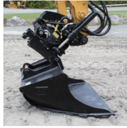
カブラで交換も容易