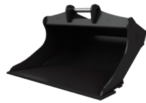
グレーディングバケット (法面整形用)

バケットに加えてソーティンググラブをラインアップ。SecureLock™ システム搭載のSカブラはキャブ内スイッチ操作で容易にワークツールの交換ができ、1台で何役もこなせます。