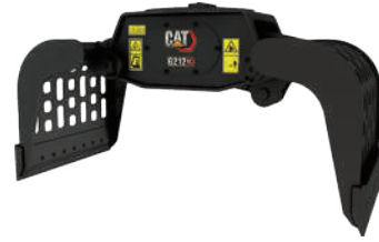
ソーティンググラブ