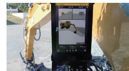
写真はオプションの10インチモニタ

※チルトローテータの回転角度によって使用可能なテクノロジー機能には制限があります。